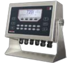
Rice Lake 720i Indicador de peso digital